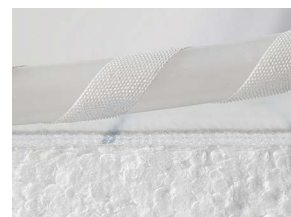
Rohr mit Klettbefestigung